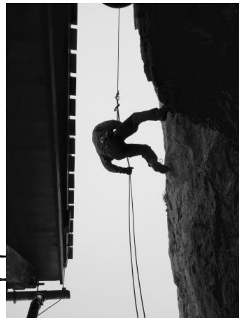
Abstieg durch Abseilen