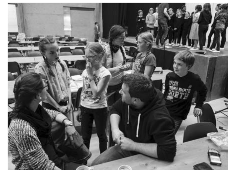
Intensive, aber spannende Proben