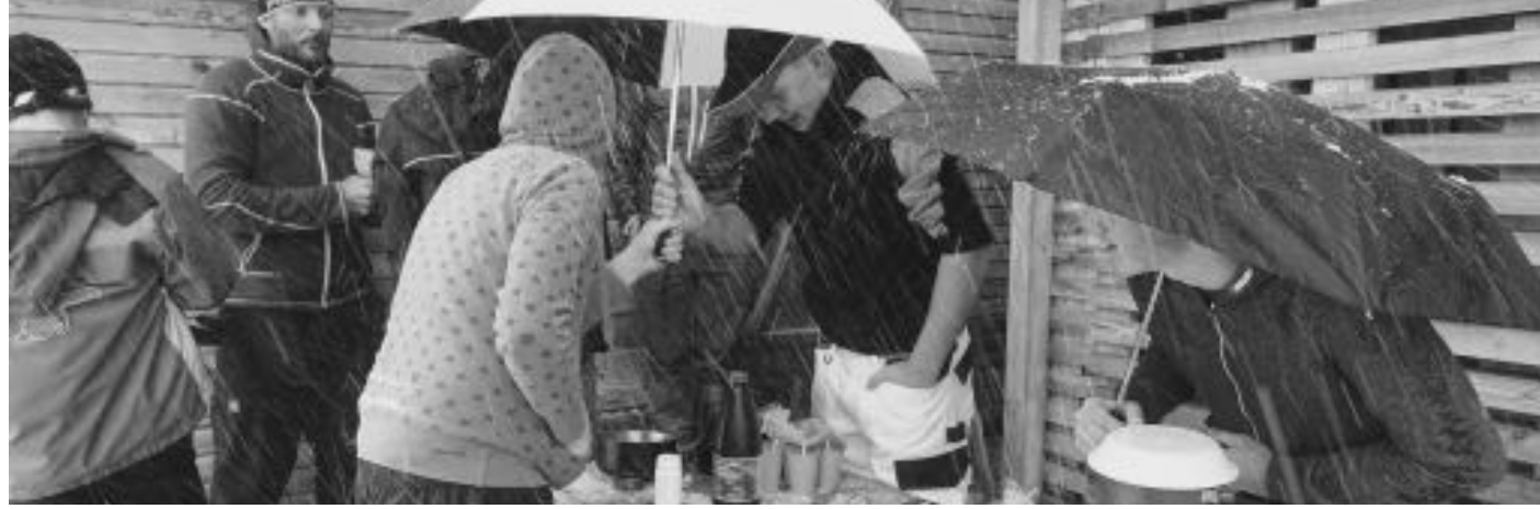
Kochen im Schneetreiben