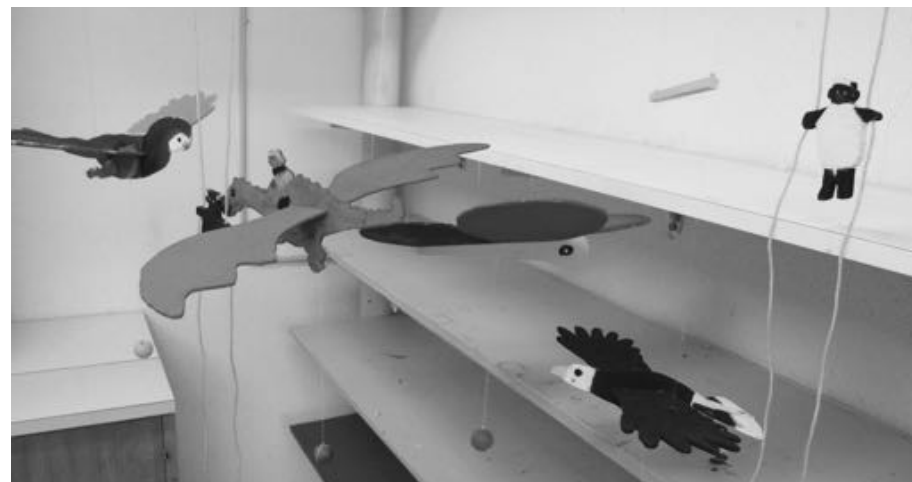
Die fertigen Produkte aus dem Atelier „Laubsägen“.