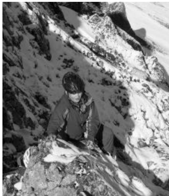
Klettern auf den winterlichen „Gross Hächlenzahn“ durch das „Dräckgässli“

Weitere Informationen: http://www.schule-escholzmattmarbach.ch/blog/project4000/