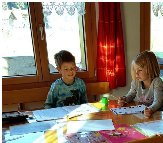
Das Zuhause wird zum Schulzimmer