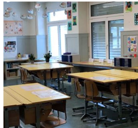
vereinsamtes Schulzimmer in Wiggen

Mit den Kindern in Kontakt zu sein, ihre Arbeiten einzufordern und ihnen darauf eine Rückmeldung zu geben, nimmt viel Zeit in Anspruch – aktuell mehr als beim regulären Schulbetrieb, aber es ist eine Herzensangelegenheit. Das Herausforderndste ist im Moment zum einen die Ungewissheit, wie lange diese Situation noch dauern wird. Zum anderen auch die Tatsache, die Kinder beim Erfüllen der Aufträge nicht beobachten und ausreichend unterstützen zu können, nicht feststellen zu können, wie es ihnen beim Lösen der Arbeitsaufträge geht, nicht auf ihre Tagesverfassung und aktuellen Bedürfnisse Rücksicht nehmen zu können.