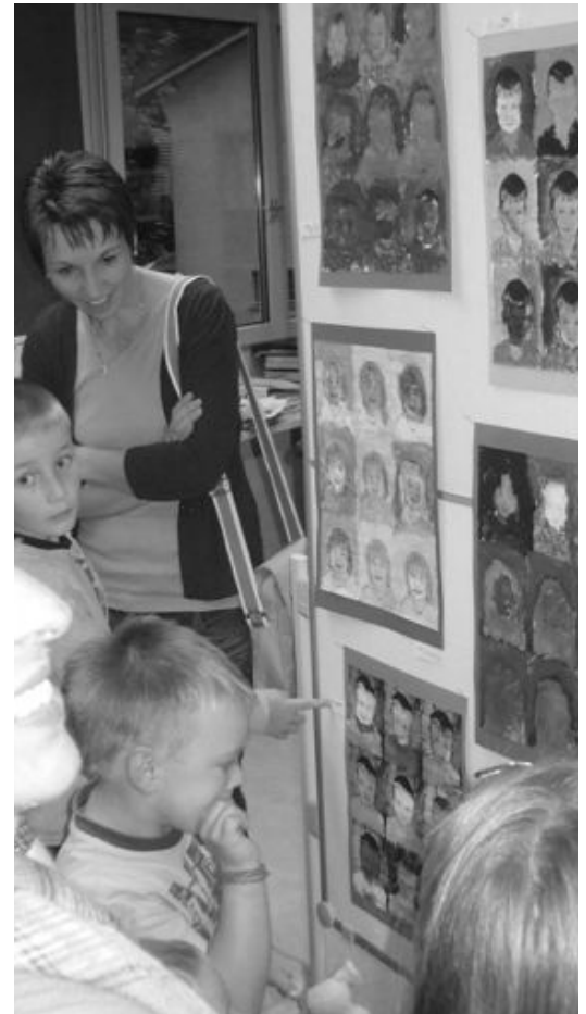
Die einen sind stolz ..., die anderen auch ...

Am Abend wurden die unerwartet vielen Gäste vom Begrüssungsteam herzlich willkommen geheissen. Sofort zeigte jedes Kind seinen Besuchern mit Stolz seine Kunstwerke und pries sie zum Kauf an. Ein zufriedenes Raunen ging durch die beiden Schulzimmer. Dank dem Einsatzplan verliefen dann der anschliessende Verkauf sowie die Bewirtung im Bistro reibungslos. Stolze Kinder mit strahlenden Augen und roten Backen zeugten von einer gelungenen Zusammenarbeit. Auch die Besucher genossen den Abend, wissend, dass sie mit ihrem Erscheinen Dankbarkeit und Anerkennung für die Arbeit der Kinder und Lehrerinnen kundtaten.