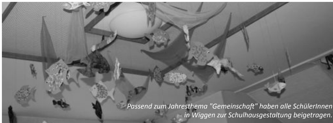
Passend zum Jahresthema "Gemeinschaft" haben alle SchülerInnen in Wiggen zur Schulhausgestaltung beigetragen.

Seit dem 1.1.2013 leben wir in der Gemeinde Escholzmatt-Marbach. Die Umsetzung der Fusion im Schulbereich ist ein Thema, welches definitiv erst auf Beginn des Schuljahres 13-14 abgeschlossen sein wird. Zum Start der neuen Gemeinde möchten die Schulen mit dieser ersten gemeinsamen Ausgabe des „Treffpunkt Schule“ über aktuelle Schulfragen informieren und einen Einblick in den Schulalltag vom Kindergarten und der Basisstufe bis ins 9. Schuljahr ermöglichen.